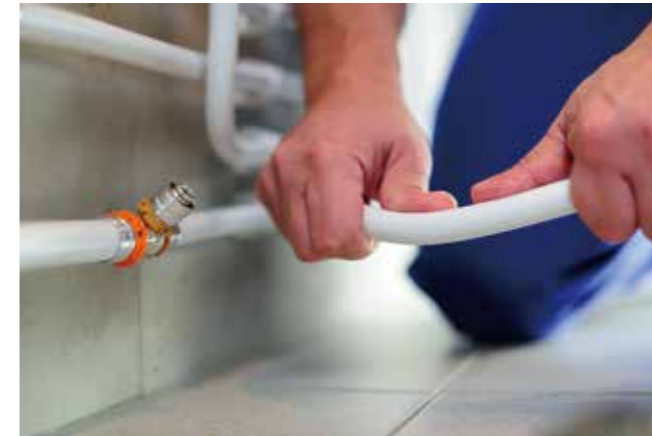
供水系统安装示意